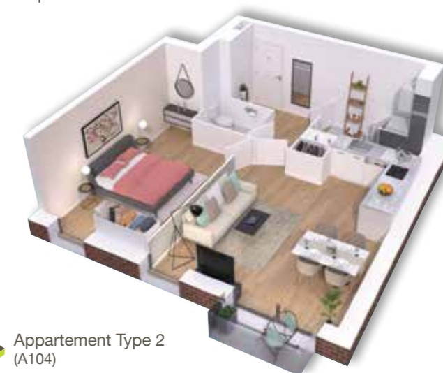
➤ Appartement Type 2 (A104)