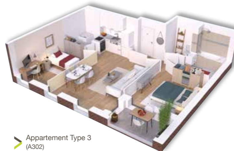
➤ Appartement Type 3 (A302)